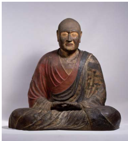
鑑真和上坐像(国宝) 唐招提寺