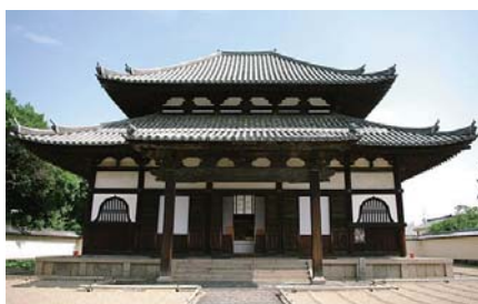
戒壇堂(戒壇院は、講堂・僧坊・迴廊も備えていたが、火災で焼失。戒壇堂と千手堂だけが復興された)

鑑真が日本に伝えたのは、戒律を授ける師僧三人、証人僧七人の十人からなる 授戒の作法 。七五五年、東大寺戒壇院が完成