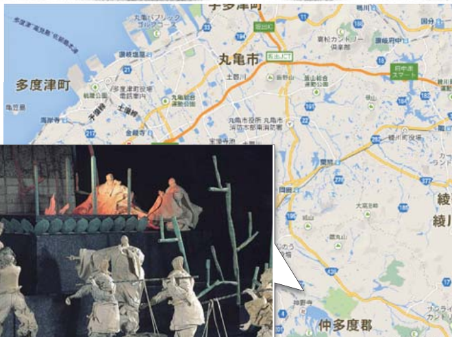
満濃池は現在も香川県仲多度郡にあり、洪積丘陵の侵食谷をせきとめた日本一の溜池として知られています。