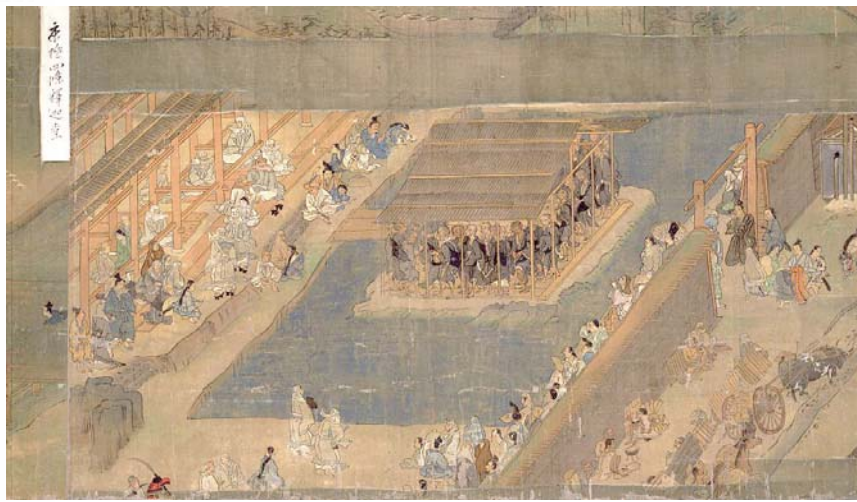
踊り念仏のようす「一遍上人絵伝」(国宝)