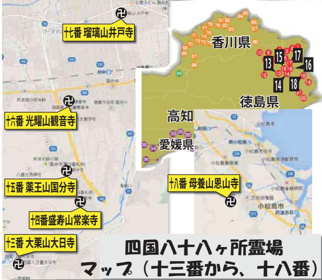
四国八十八ヶ所霊場 マップ(十三番から、十八番)

お遍路の回数によって納札の色は異なり、白(一〜四回)、緑(五〜七回)、赤(八〜二十四回)、銀(二十五〜四十九回)、金(五十〜九十九回)、錦(百回以上)です。