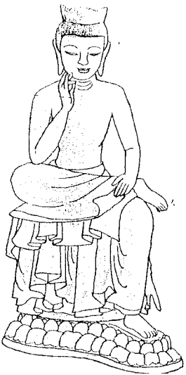
弥勒菩薩半跏思惟像

弥勒菩薩は、五十六億七千万年後にどうやって衆生を救うかをいつも考えています。その思案中の姿が 半跏思惟（はんかしゆい）像 と言われています。 左足を踏み下げ、右足を曲げて左膝の上に置き、右手で軽く頰杖をついたポーズ です。「ああ、それ知つとるがね」と呟かれた方も多いことと思いません。そう、そのポーズをとっているのが弥勒菩薩です。