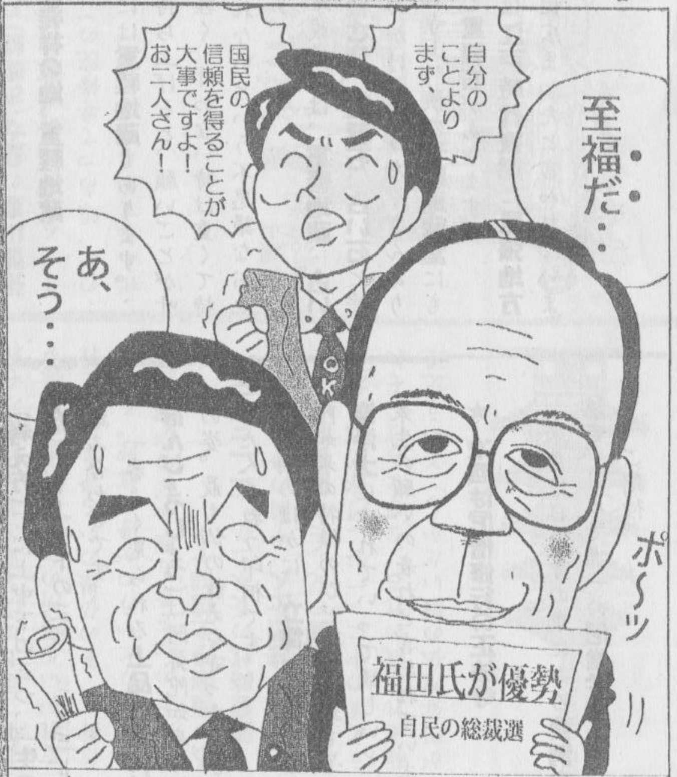
「信なくんば立たず」