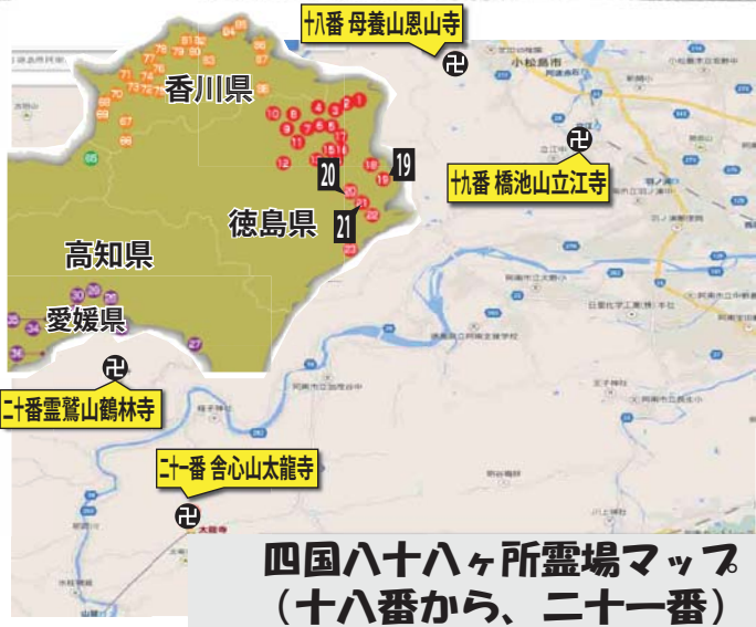
四国八十八ヶ所霊場マップ (十八番から、二十一番)