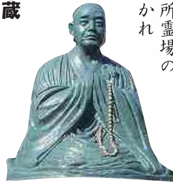
亮山阿闍梨像(妙楽寺)

夢告を受けて霊場開創を決意した亮玄は、翌日、四国八十八ヶ所霊場の巡拝に旅立ちます。