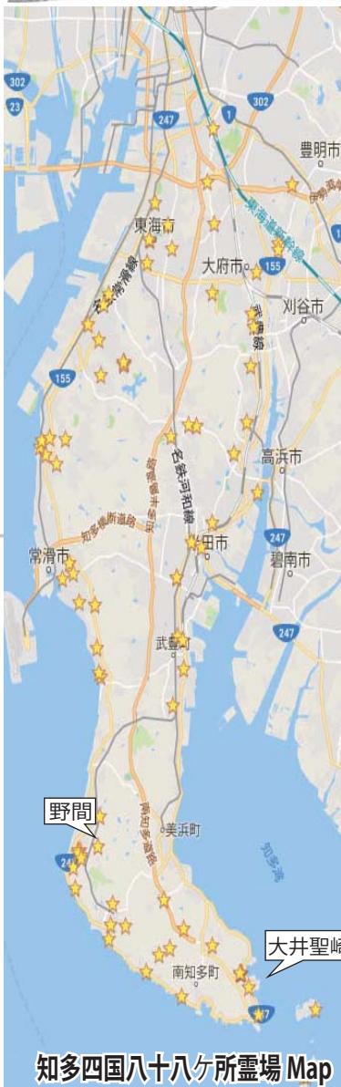
知多四国八十八ヶ所霊場 Map

さて、来月からいよいよ出発です。豊明市の 曹源寺 が一番札所。桶狭間の戦いの戦死者を弔う 戦人塚 があります。乞ご期待。